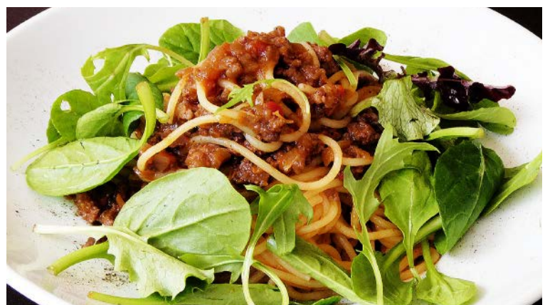
生パスタ とちぎ和牛のボロネーゼ