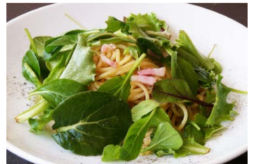
生パスタ 醤油&バター