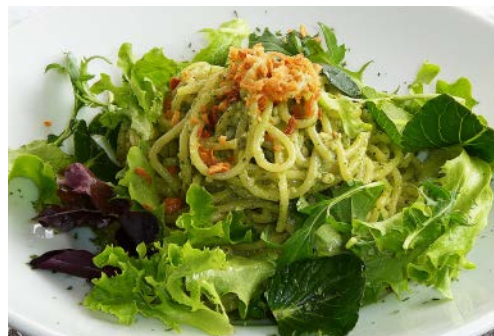
生パスタ ジェノベーゼ