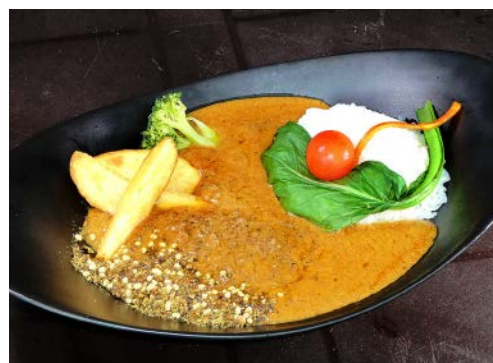
栃木県産和牛そばろカレー