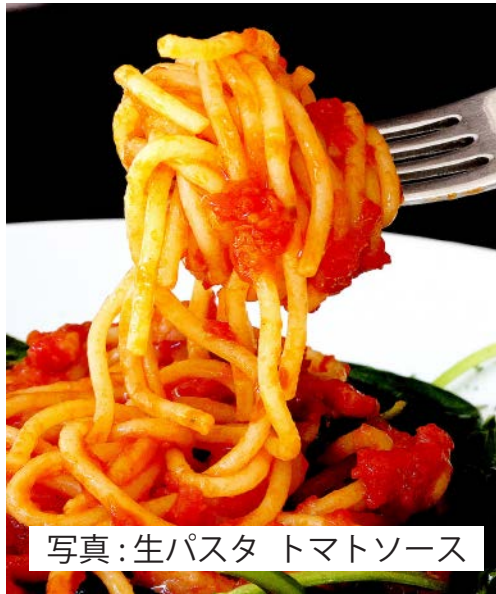
写真:生パスタ トマトソース