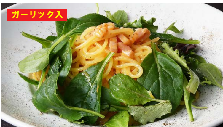
生パスタ 那須御養卵のカルボナーラ