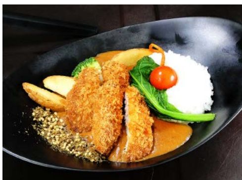
栃木県産豚のカツカレー