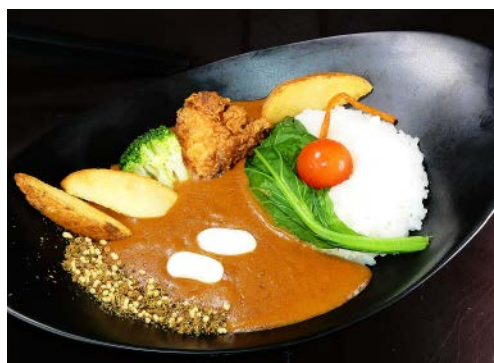
茶臼岳カレー 森と大地