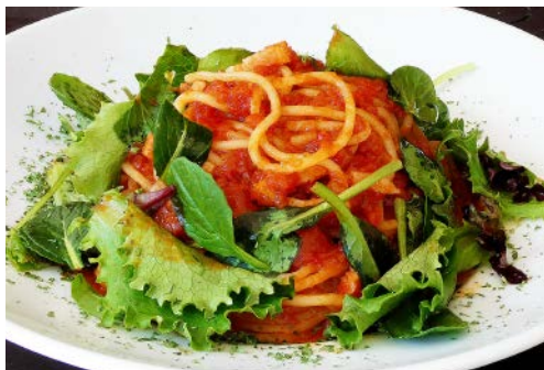
生パスタ トマトソース